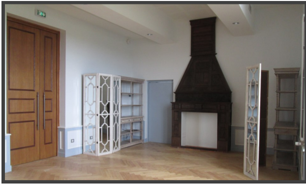
SALLE A MANGER