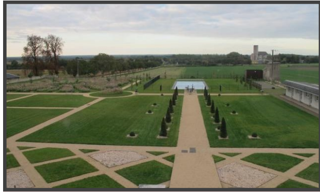
JARDIN A LA FRANCAISE