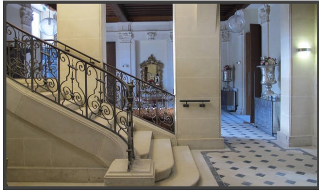
HALL D'ENTRÉE & ESCALIER